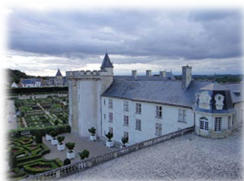
Banquet はシャトー (お城) で